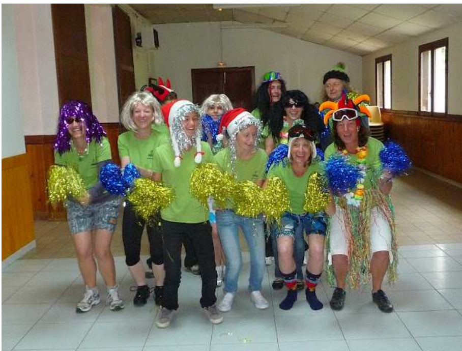
Multi gym-adulte, petite représentation sportive à la fête du Chastel

« pour clôturer cette année sportive, comme chaque année un repas intergénérationnel a été organisé, le 8 juin 2012, sous le signe de la convivialité. »