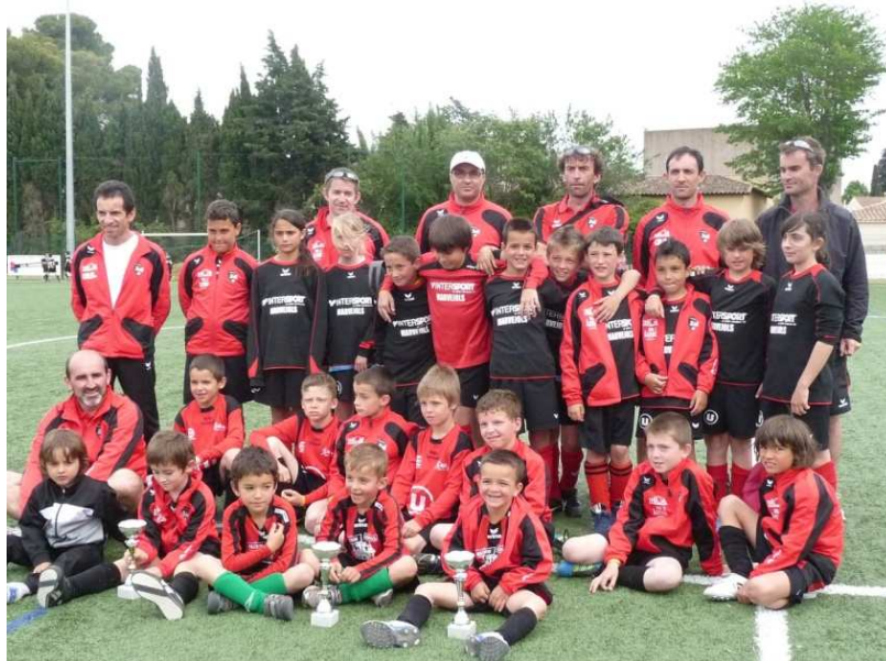
U7, U9 et U11 – Tournoi à Montagnac (34) avec séjour agréable pour l'ensemble des joueurs, encadrants et leurs familles au bord de la mer

« Débutants ou confirmés, tous seront les bienvenus dans les équipes regroupées au sein des niveaux suivants ... »